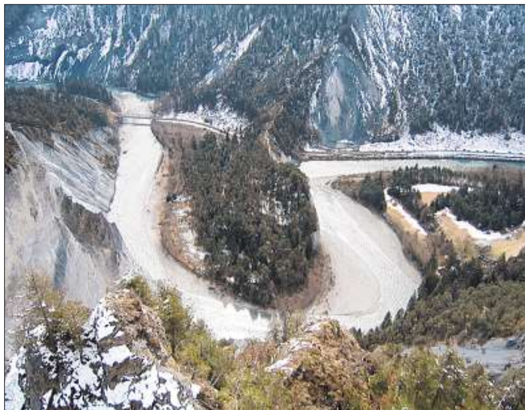
Ina da las candidatas per daventar ina «Zona Smaragd»: la Ruinaulta tranter Glion e Panaduz.