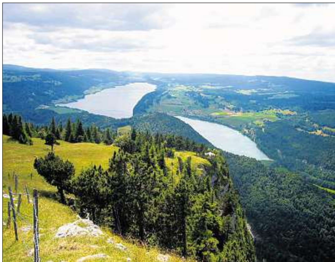
La Vallée de Joux sainza lingias electricas al liber che flancheschan il lai.